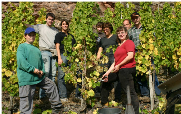
Unser Ernteteam 2005

Das WeinGut Benedict Loosen Erben liegt im malerischen Ortskern, neben dem Rathaus mit Tourist-Information. Erbaut wurde das stattliche Patrizierhaus von Mönchen der ehemaligen Augustiner Abtei Springiersbach, auf den Grundmauern eines Gewölbekellers aus dem Jahre 1511.